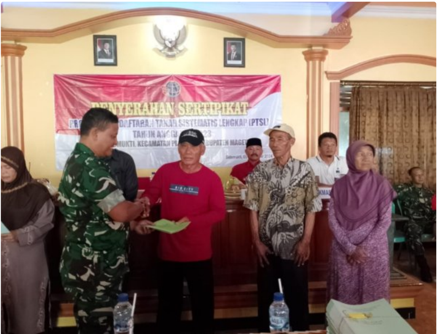
Danramil 0804/02 Plaosan Hadiri Penyerahan Sertifikat Program Pendaftaran Tanah Sistematis Lengkap (PTSL) Desa Sidomukti

PLAOSAN. - Desa Sidomukti melalui Badan Pertanahan Nasional (BPN)